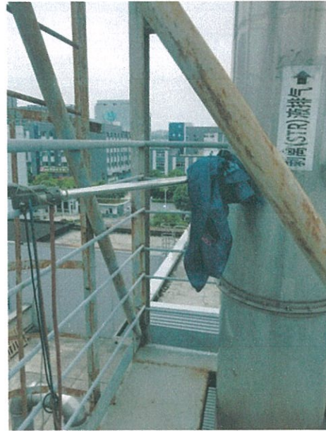
有组织废气 (◎5#) 监测点位