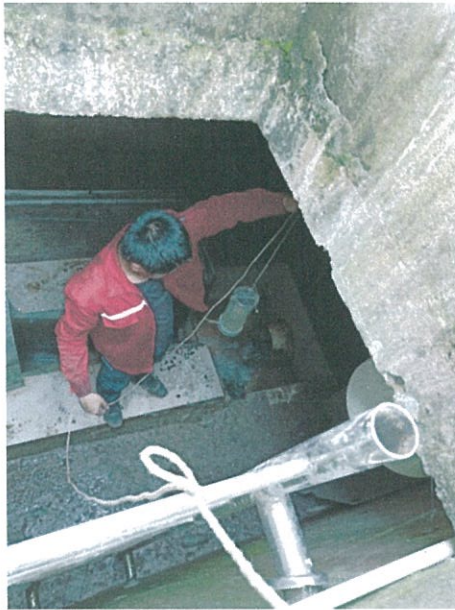
废水 (★1#) 监测点位