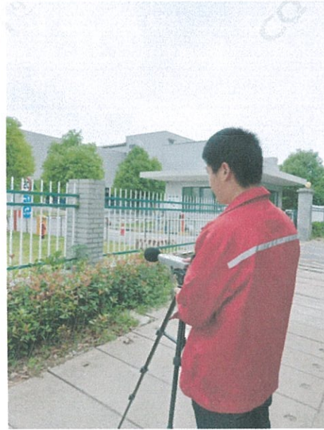
噪声 (▲1#) 监测点位