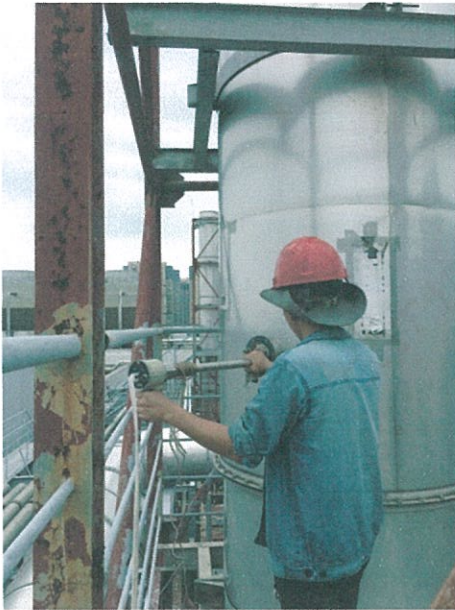
有组织废气 (◎2#) 监测点位