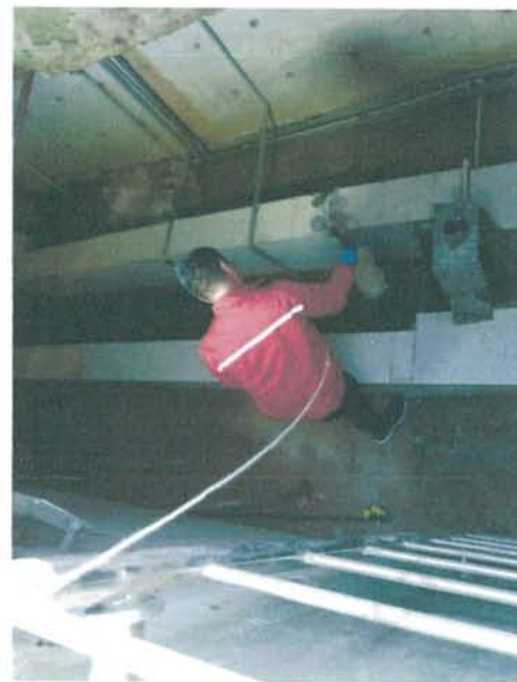
废水 (★1#) 监测点位