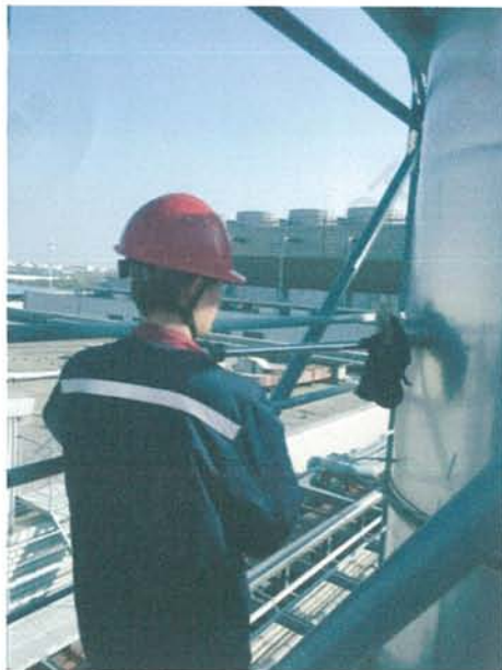
有组织废气 (◎1#) 监测点位